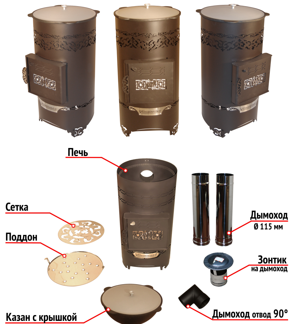
Рисунок 3. Универсальная печь-казан «САМАРКАНД»