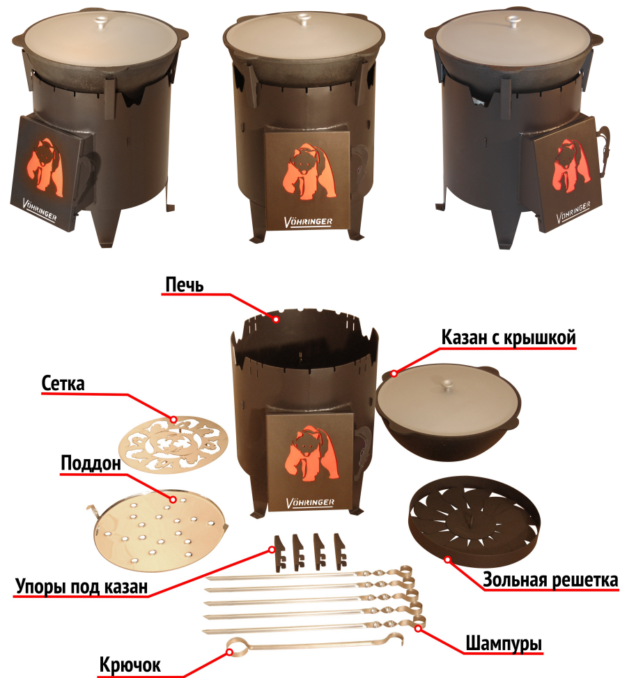
Рисунок3. Универсальная печь-казан «САМОБРАНКА»